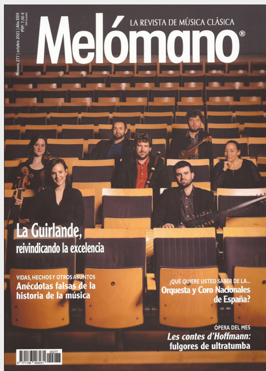
La Guirlande Portada de la revista Melómano. Octubre 2021